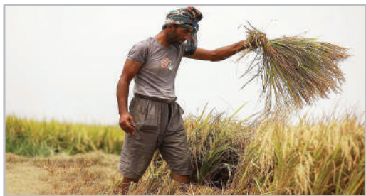
برداشت برنج - شالیزارهای مازندران