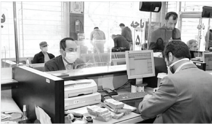
اعطای تسهیلات قرض‌الحسنه امتیازی با میانگین‌گیری، بدین ترتیب که پس از سپرده‌گذاری مشتری و بر اساس میانگین امتیاز وی، مؤسسه اعتباری بدون شرط

قبلی نسبت به پرداخت تسهیلات اقدام می‌کند، خلاف شرع نیست. نکته کلیدی در این روش آن است که مؤسسه اعتباری نباید هیچ نوع تعهد حقوقی برای پرداخت تسهیلات به مشتری بدهد و این موضوع باید به شیوه مناسب (شفاف‌سازی در متن قرارداد، اطلاع‌رسانی بر روی تارنمای مؤسسه اعتباری، ارسال پیامک و غیره) به مشتری اعلام شود.