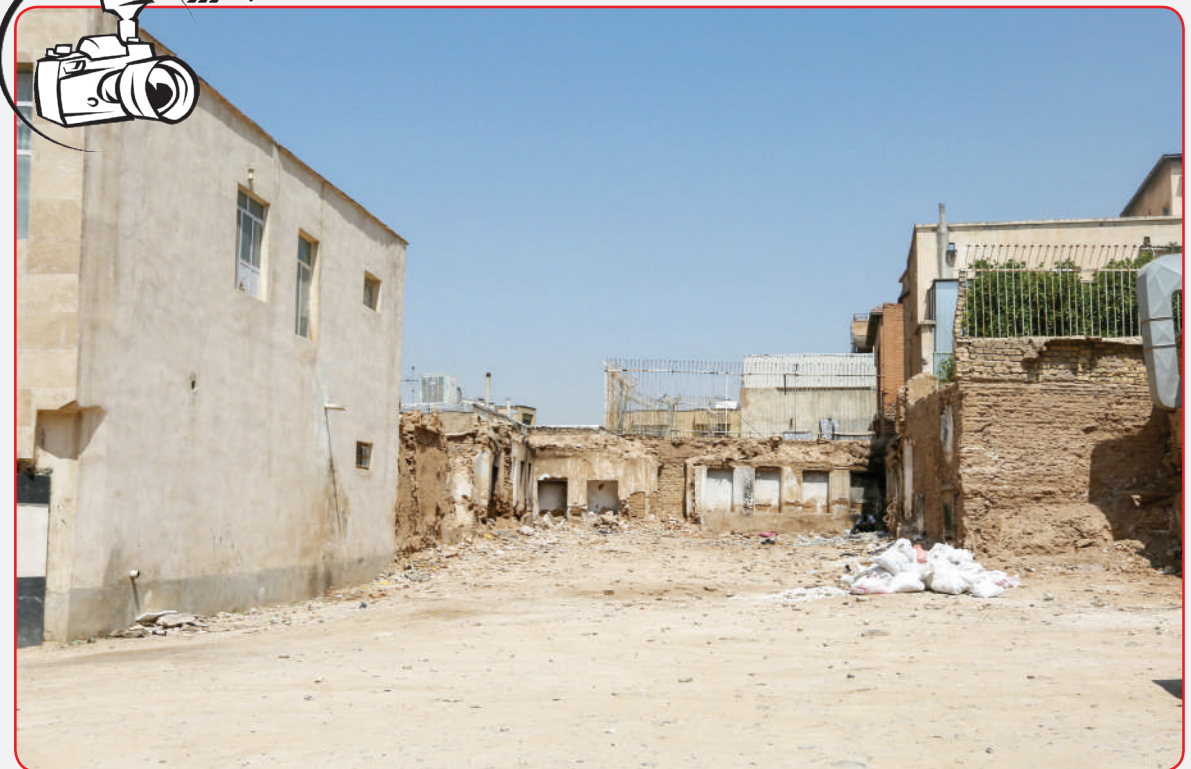
ویرانه‌هایی که ظاهر بافت تاریخی را در معرض خطر قرار می‌دهد