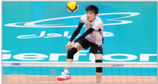
دیدار تیم‌های والیبال ایران و هنگ کنگ