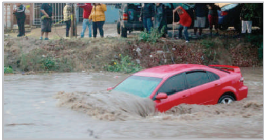
سیل - مکزیک