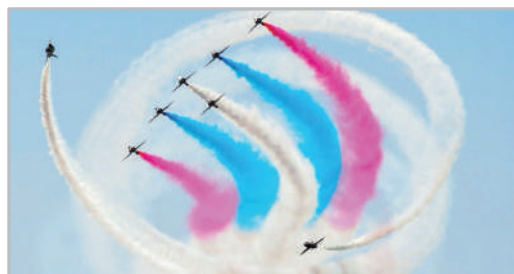
نمایش هوایی - لندن