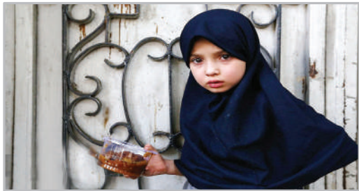
نذر حلوا یزان - تهران